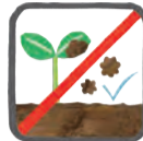
土の跳ね返り防止