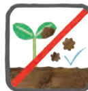
土の跳ね返り防止